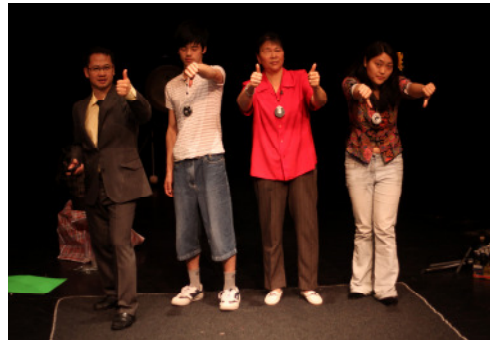
C' est du chinois