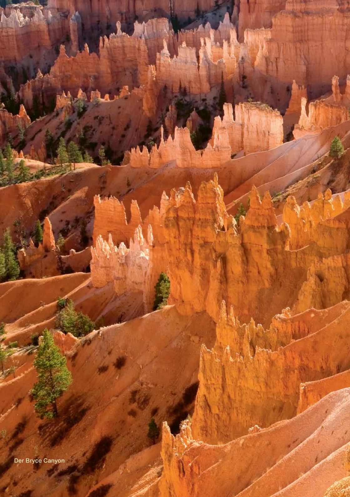
Der Bryce Canyon