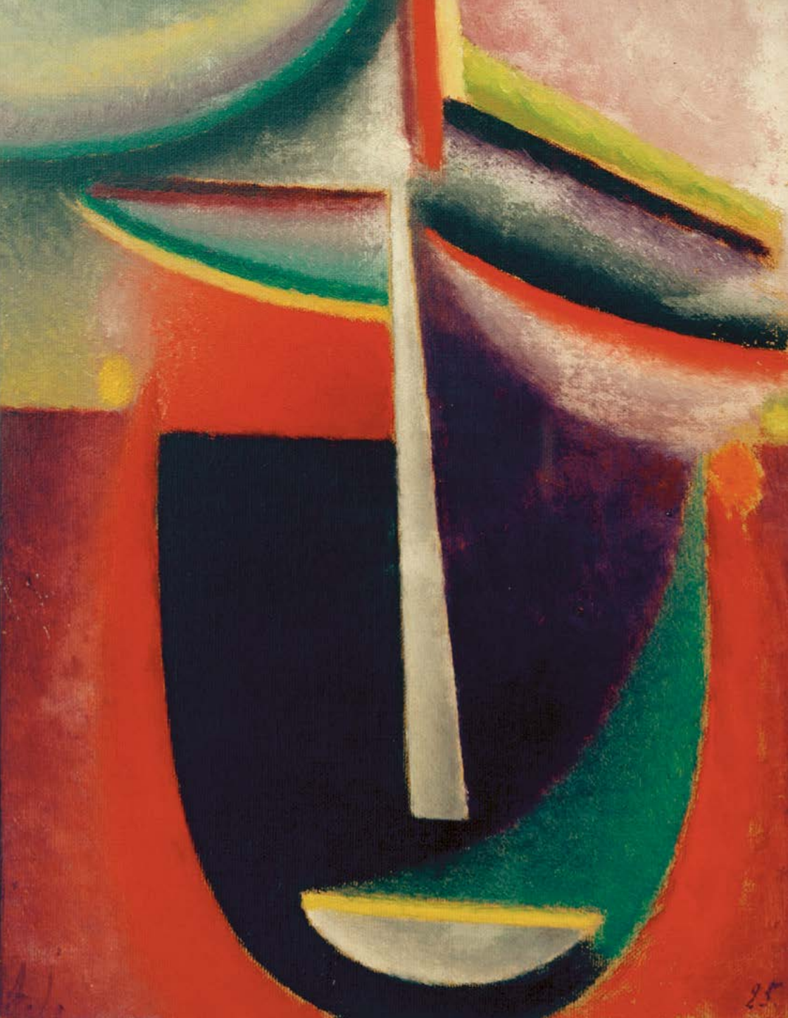
Alexej von Jawlensky, Abstrakter Kopf: Mysterium , 1925